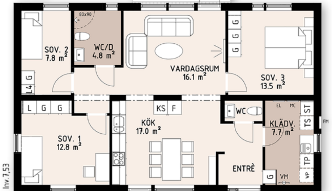
4 rum och kök