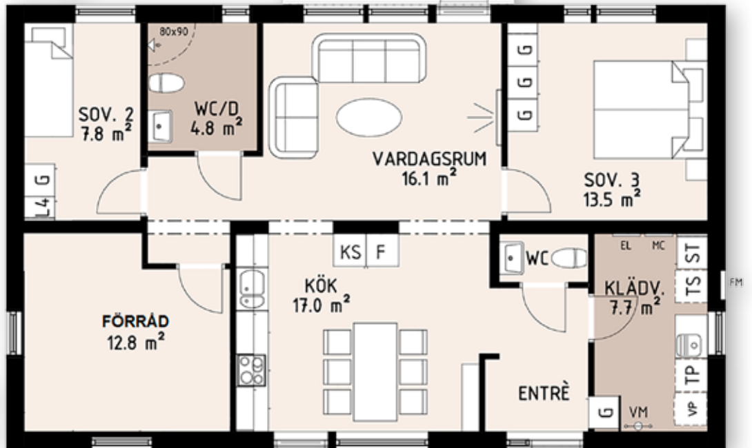
3 rum och kök