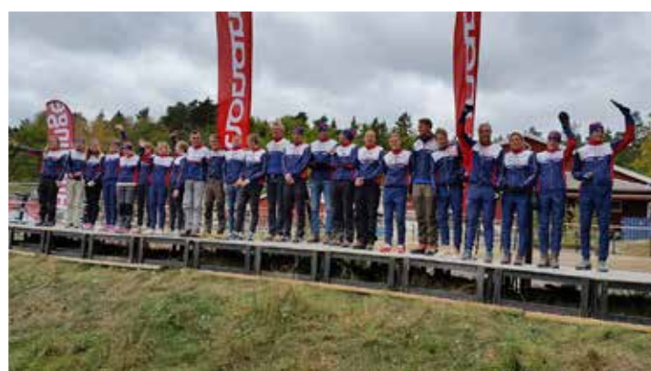
OK Tisarens lag – bestående av ungdomar, elit och äldre, både kvinnor och män – blev femma i 25-mannastafetten i Stockholm i höstas i konkurrens med cirka 350 startande lag.

– Då kommer pengarna väl till pass, men vi måste givetvis skjuta till eget ideellt arbete också.