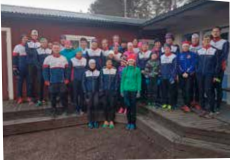
Julafton 2016. Före julmaten passade det här gänget på att springa en tur till klubbstugan.